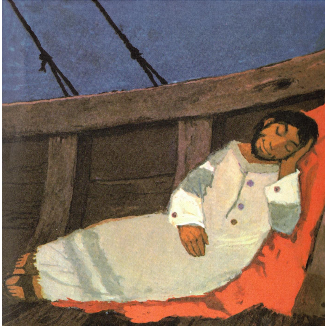
Mt. 8, 23-27; Mk. 4, 35-41; Luk. 8,22-25; Bild: Kees de Kort