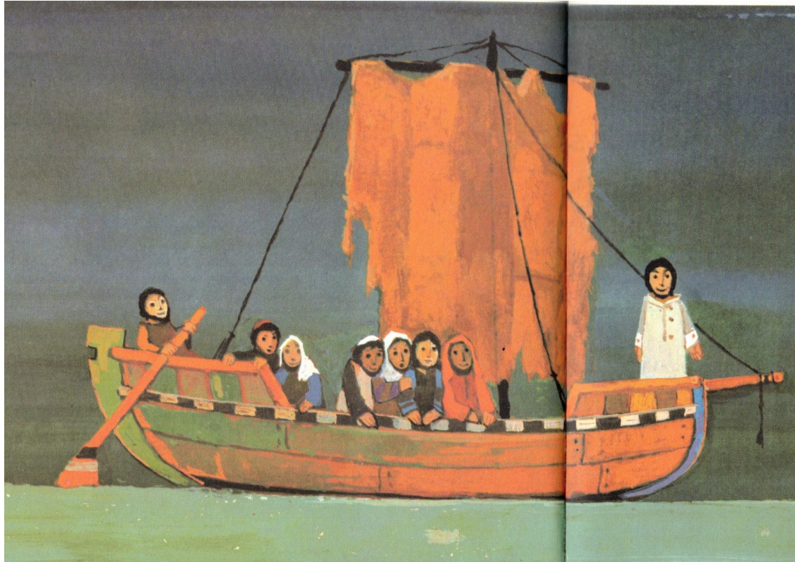
Mt. 8, 23-27; Mk. 4, 35-41; Luk. 8,22-25; Bild: Kees de Kort